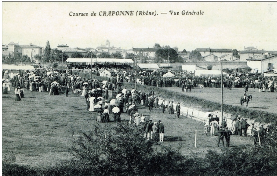
* L'Hippodrome de Grand-Champ

Puis le champ de courses se déplaça et devint « * Hippodrome de Grand-Champ ». Les courses y étaient organisées dès 1906.