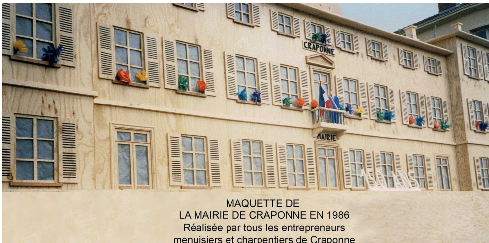
MAQUETTE DE LA MAIRIE DE CRAPONNE EN 1986 Réalisée par tous les entrepreneurs menuisiers et charpentiers de Craponne

Par exemple, pour la célébration des 150 ans de la création de la commune de Craponne, en 1986, il s'est beaucoup investi avec d'autres collègues dans la fabrication d'une très grande maquette représentant la mairie.